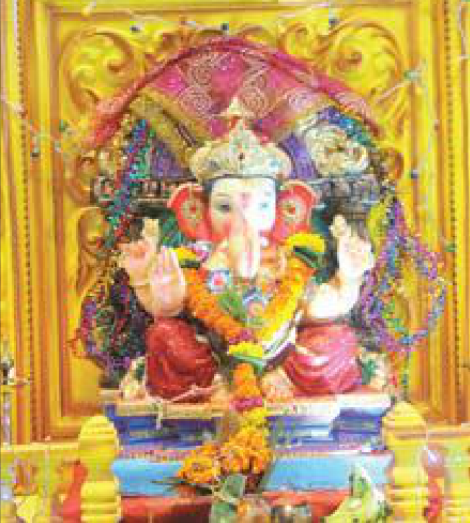
'हमारा महानगर' के रबाले प्रेस में स्थापित प्रथमेश की प्रतिमा का मंगलवार को धूमधाम से विसर्जन किया गया