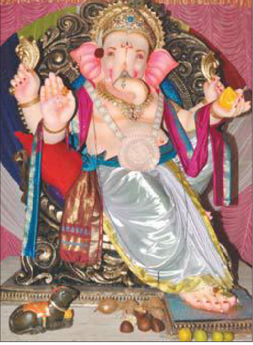
कालबादेवी में स्थापित कालबादेवी का राजा