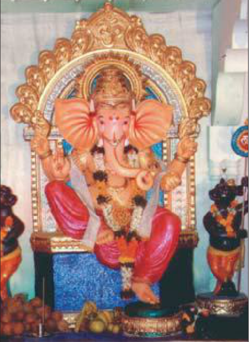
सांताक्रुज पूर्व नवा आग्नीपाडा सार्वजनिक गणेश मंडल की प्रतिमा