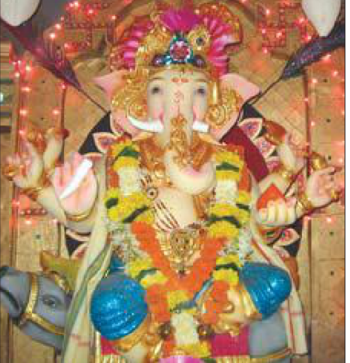
गोरेगांव पूर्व साईधाम सोसाइटी, बंगाली कपाडंड में स्थापित प्रतिमा